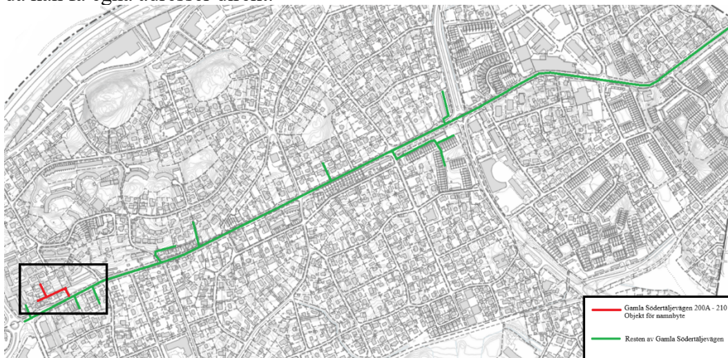
Karta 1. Gamla Södertäljevägens hela sträckning. Se karta 2 för Gamla Södertäljevägen 200A-210

Vid fastigheterna som idag har adresser Gamla Södertäljevägen 200A – 210 finns det inget utrymme för förtätning av adresser. I dagsläget finns det minst ett attefallshus som behöver en adress. För att då kunna sätta adress behöver flera fastigheter byta adress, eller så kan man sätta in en senare bokstav i alfabetet. Därför vill förvaltningen ge denna vägsträcka ett eget namn för att kunna börja en ny nummerserie. Detta kommer underlätta för framtida attefallshus i området som då kan få egna adresser direkt.