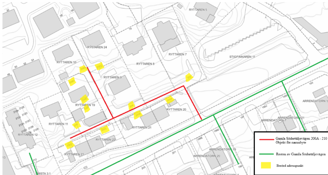
Karta 2. Utbredning av adresser som behöver ändras till följd av vägnamnsbytet.

I kvarteret Ryttaren är det elva fastigheter som påverkas av väg- och adressbytet. Adressnummer fastställs i separat beslut på delegation av nämnden till handläggare, tidigast fyra veckor efter att nämndens beslut vunnit laga kraft.